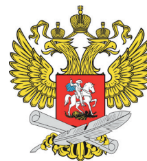
Министерство просвещения РФ