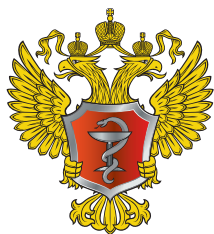
Министерство здравоохранения РФ

Не растерявшись в экстренной ситуации и правильно оказав первую помощь, вы спасете ребенку жизнь!